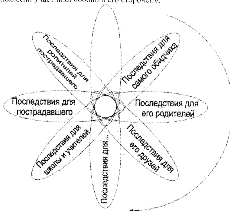
Рис .2. Ромашка последствий

Разговор о последствиях задает пространство для анализа (рефлексии) произошедшего и своих дальнейших действий, и это не оставляет возможности сделать вид, что ничего не случилось. Если негативные последствия осознаны, то они требуют от осознавшего активности по исправлению ситуации. Разговор о последствиях и ответственности труден как для взрослых, так и для подростков, нередко люди пытаются уклониться от таких вопросов. И некоторые начинающие медиаторы, опасаясь разрыва контакта и создания дискомфорта, не поднимают вопроса об ответственности за причиненный вред. Однако медиация не обязательно должна быть приятной и комфортной, она должна реализовывать свои принципы, среди которых одним из важнейших является принятие сторонами конфликта ответственности за исправление негативных последствий. Эту тему нельзя игнорировать. Тем более что она касается одной из важнейших ценностей: воспитания и дальнейшей судьбы несовершеннолетнего правонарушителя. Поэтому медиатор поднимает вопрос ответственности, даже если участники «обошли его стороной».